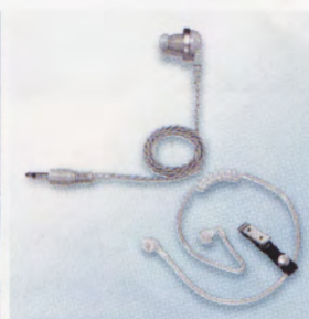
▲イヤホン EH-15 ▶イヤホンアダプター SP-32