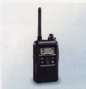
▲携帯型トランシーバー IP100H