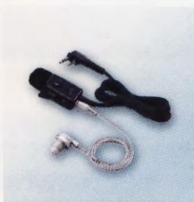
▲タイピンマイクロホン HM-153LS