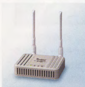
▲無線LANアクセスポイント AP-90M