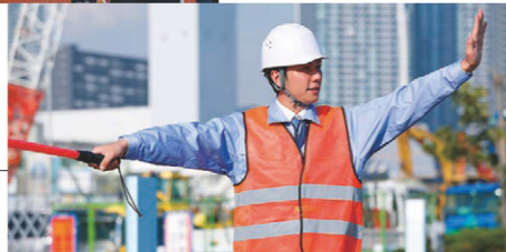
建設・ 工事現場でも