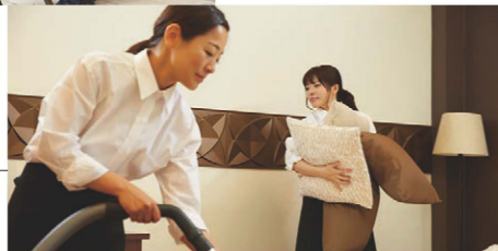
ホテルなどでの 清掃作業に