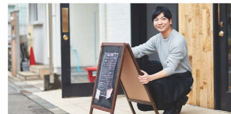
フロアが分かれた 店舗などで

スタッフ同士のコミュニケーション向上に最適 飲食業や建設業、地域防災はじめ、多彩な業界やシーンで活用可能