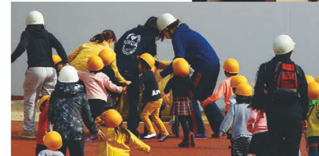
地域防災・ レクリエーションに