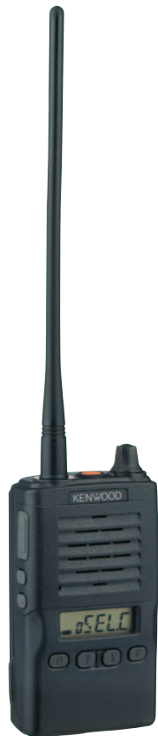
TCP-523 UHF帯 簡易無線電話装置 (小エリア簡易無線)