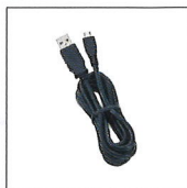
USBケーブル USB電源 モニタリング用 (EDS-32)