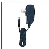
ACアダプター AC100V電源 モニタリング用 (EDC-323)