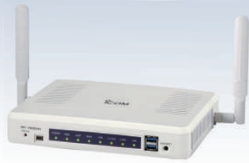
ワイヤレスアクセスポイント SR-7100VN