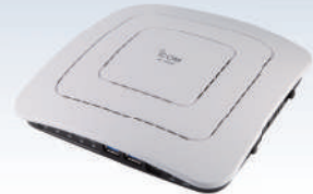
ワイヤレスアクセスポイント AP-9500

IEEE802.11ac 準拠、 2.4GHz帯と5GHz帯の同時通信に 対応した高性能アクセスポイント。