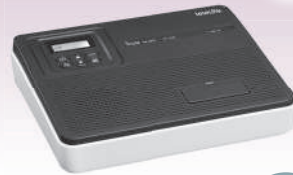
インターフェースボックス VE-SP2

外形寸法: 約 216.8 (W)× 173.3 (D)× 52.8 (H)mm (突起物を除く)