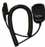
小型スピーカーマイク SK-M51

※運転中のイヤホン、ヘッドホンの装着は各都道府県の条例で規制されている場合があります。