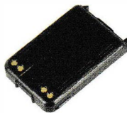
電池パック M (1900mAh) SK-P52