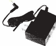
充電器用ACアダプタ SK-P55