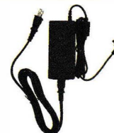
連結型充電器用ACアダプタ SK-P58