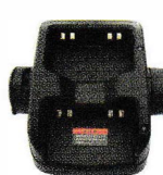
2 連連結充電器 SK-P57