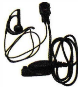
小型タイピンマイク&イヤホン SK-M53