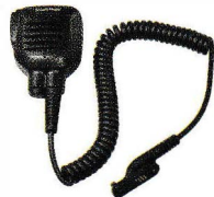
防水スピーカーマイク SK-M52