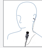
SSM-50H タイピンマイク &イヤホン