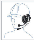
SSM-61H 工事ヘルメット用 ヘッドセット

*SSM-61H/SSM-62H/ SSM-50H使用時に接続して 本体に装着します。 *通話ボタン、CUEボタン装備