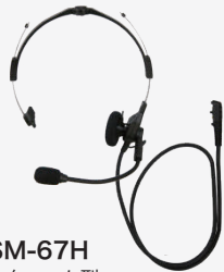
SSM-67H インターコム型 ヘッドセット