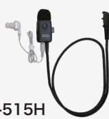
SSM-515H タイピンマイク &イヤホン