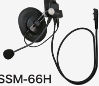
SSM-66H 工事ヘルメット用 ヘッドセット

※親機など、常時同時通話で運用する場合に便利です。(通話ボタン/CUEボタンはありません)