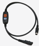
SCU-49 ヘッドセット接続ケーブル

*SSM-61H/SSM-62H/ SSM-50H使用時に接続して 本体に装着します。 *通話ボタン、CUEボタン装備