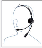
SSM-62H インターコム型 ヘッドセット