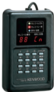
セレコールターミナル TSS-10