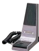
スタンドマイク スタンドマイクは受注生産での対応となります。 弊社無線システム営業部にご相談ください。 Tel:045-443-3122