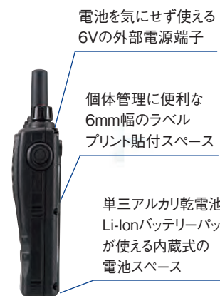
電池を気にせず使える 6Vの外部電源端子