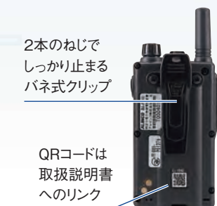
2本のねじで しっかり止まる バネ式クリップ