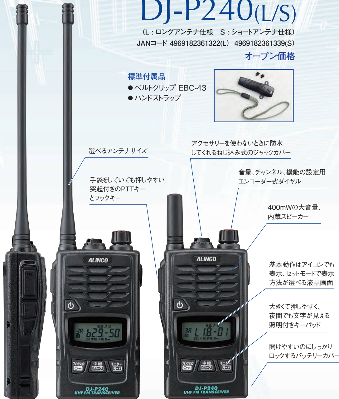
選べるアンテナサイズ