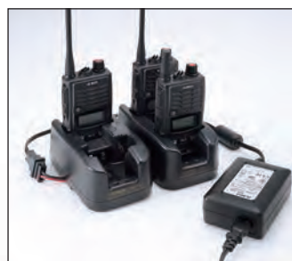
工具不要で最多4台のEDC-167RとEDC-162 ACアダプター1台を組み合わせ、8台同時に充電できるマルチチャージャーが作れます。