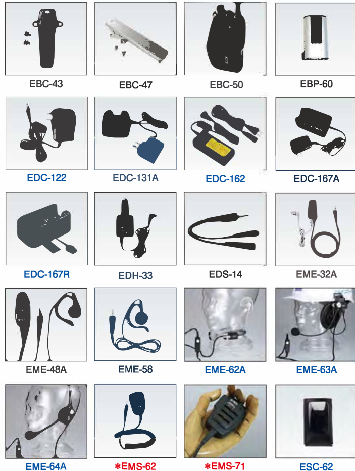
EME-64A *EMS-62 *EMS-71 ESC-62