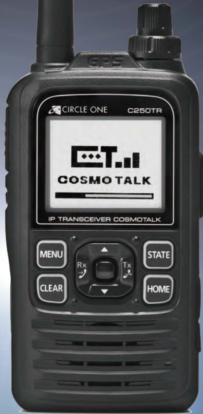
ハンディ・コスモトーク C250TR