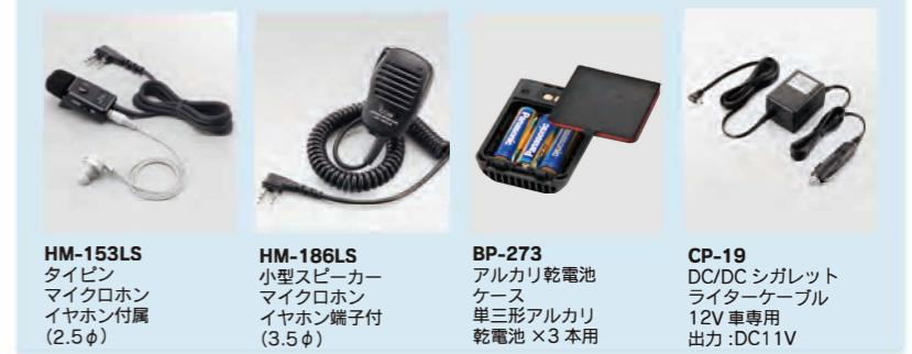
HM-153LS タイピン マイクロホン イヤホン付属 (2.5φ)