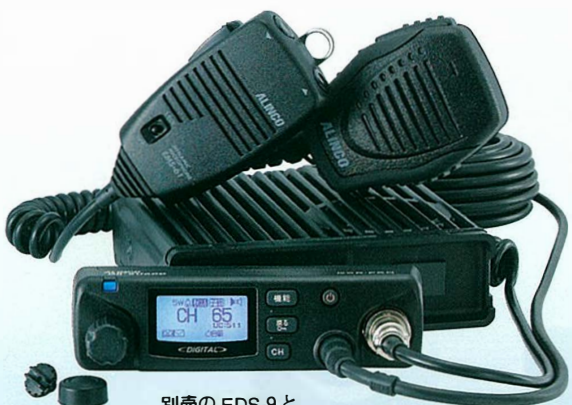
別売の EDS-9 と EMS-501 装着時

片方でも両方でも使える、ツインマイクポート。オプション側はスピーカーマイク部分が防水なので濡れた手で持っても安心です。5mケーブルを使えばしぶきが掛かる車外作業中でも通話可能!