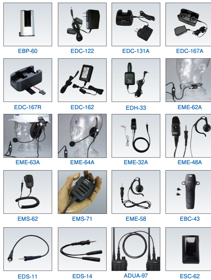
EBP-60 EDC-122 EDC-131A EDC-167A EDC-167R EDC-162 EDH-33 EME-62A EME-63A EME-64A EME-32A EME-48A EMS-62 EMS-71 EME-58 EBC-43 EDS-11 EDS-14 ADUA-97 ESC-62