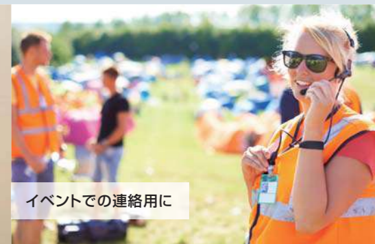
イベントでの連絡用に