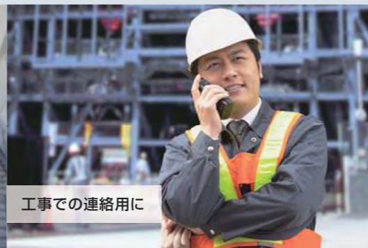
工事での連絡用に