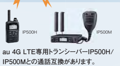
au 4G LTE専用トランシーバーIP500H/ IP500Mとの通話互換があります。