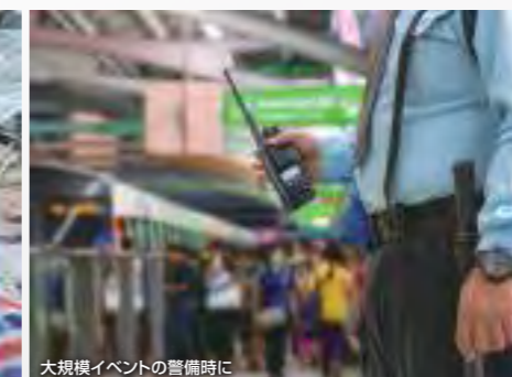
大規模イベントの警備時に

*1 バッテリーパック、アンテナ、保護カバーを正しく装着した状態で、試験用粉塵を1㎡あたり2kgの割合で浮遊させた中に8時間放置したのちに取り出して、無線機の内部に粉塵の浸入がないこと。また、水深1mの静水（常温の水道水）に静かに沈め、30分間放置したのちに取り出して、無線機として機能することです。また、一定の条件下における水滴や噴流、粉塵によっても無線機として機能することを表します。 *2 衝撃、振動、落下、低圧力など約20種類の試験を実施。