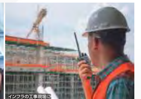
インフラの工事現場に