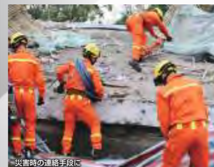
災害時の連絡手段に

短／長押しでそれぞれ機能を割り当てられるサイドキーを2つ装備しました。特定の相手や呼び出し方法を呼び出すワンタッチ機能、ユーザーコード切り替え、メッセージ選択、モニター機能を割り当てることができます。また、サブPTTスイッチにも同様の機能を割り当てることができます。