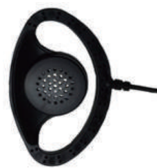
BM-GSRE2.5a / b

D 型イヤホン 2.5mm a:BM-GSV5 用 b:* B-E03wpnz, B-N01nz 用