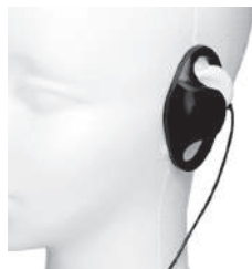
BM-GSRE D 型