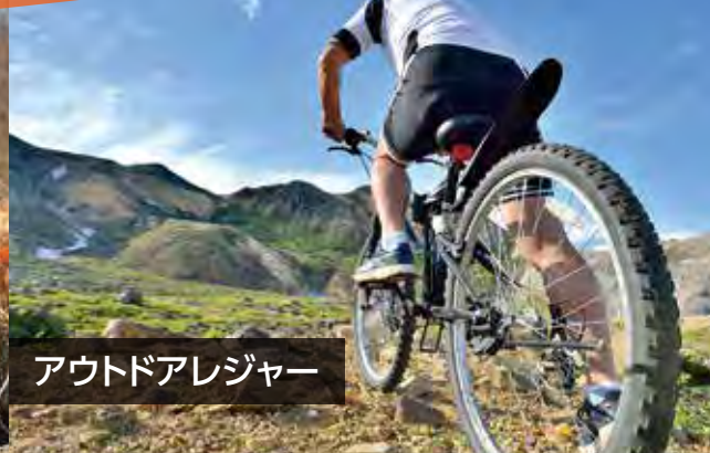
アウトドアレジャー