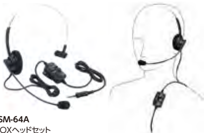
SSM-64A VOXヘッドセット 本体価格8,000円(税抜)