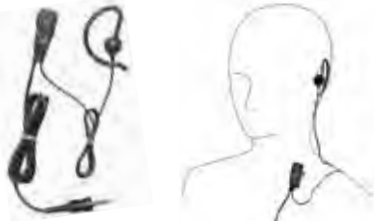
MH-381A4B 小型タイプピンマイク(耳かけイヤホンタイプ) 本体価格 3,800円(税抜)