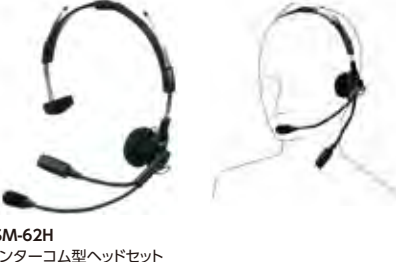
SSM-62H インターコム型ヘッドセット 本体価格4,800円(税抜)

ヘルメットに装着するタイプのヘッドセット ※本体との接続にはSCU-11が必要です。