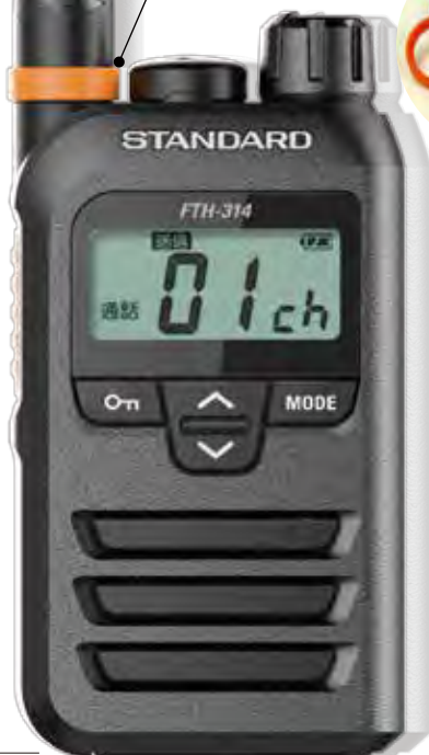
原寸大 (バックはロング アンテナモデル)