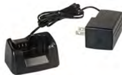
SBH-31 急速充電器セット

充電して繰り返し使用できるNi-MH電池パック ※充電は専用充電器VAC-68をご使用下さい。