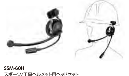
SSM-60H スポーツ/工事ヘルメット用ヘッドセット 本体価格13,200円(税抜)

ヘルメットに装着するタイプのヘッドセット ※本体との接続にはSCU-11が必要です。