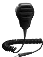
MH-73A4B 防浸型スピーカーマイク 本体価格5,200円(税抜)