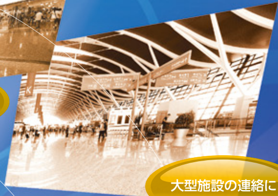
大型施設の連絡に