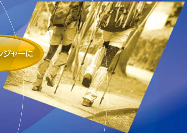
アウトドアレジャーに