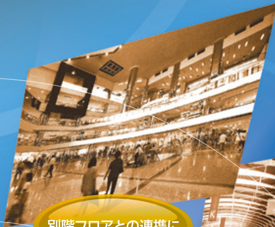
別階フロアとの連携に