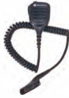
PMMN4067 IMPRES™ リモートスピーカーマイク