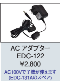
AC アダプター EDC-122 ¥2,800 AC100Vで子機が使えます (EDC-131Aのスペア)