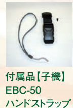
付属品【子機】 EBC-50 ハンドストラップ