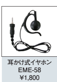
耳かけ式イヤホン EME-58 ¥1,800