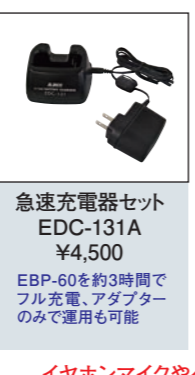
急速充電器セット EDC-131A ¥4,500 EBP-60を約3時間でフル充電、アダプターのみで運用も可能

最多接続個数: 4 最多充電台数: 8 電池単体充電: 可 接続時の工具: 不要