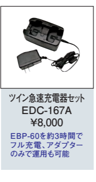
ツイン急速充電器セット EDC-167A ¥8,000 EBP-60を約3時間でフル充電、アダプターのみで運用も可能