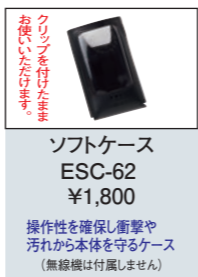
ソフトケース ESC-62 ¥1,800 操作性を確保し衝撃や汚れから本体を守るケース (無線機は付属しません)