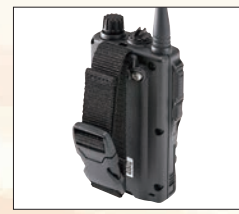
●スペアとして別売もしています。 ¥1,500

EBC-50は通常のベルト以外にも安全ベストのひもやツールベルトなど、幅8cmまで対応します。さらに、スイングすることで、腰に下げた時の違和感を無くし、ストレスが掛かりやすいアンテナやイヤホンジャックへの負担を軽減でき、子機の落下も防止します。