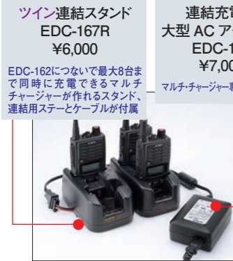
ツイン接続スタンド EDC-167R ¥6,000 EDC-162について最大8台まで同時に充電できるマルチチャージャーが作れるスタンド、連結用ステータケーブルが付属