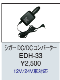
シガー DC/DC コンバーター EDH-33 ¥2,500 12V/24V車対応