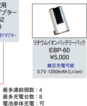
リチウムイオンバッテリーパック EBP-60 ¥5,000 継足充電可能 3.7V 1200mAh (Li-Ion)