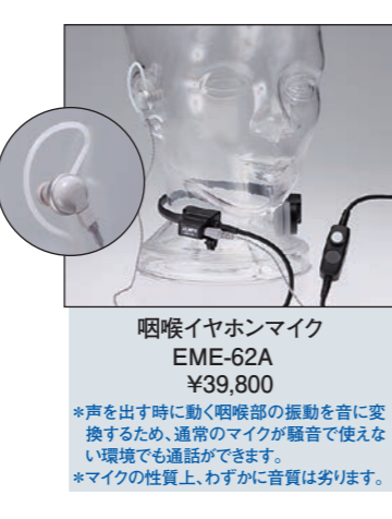
咽喉イヤホンマイク EME-62A ¥39,800 *声を出す時に動く咽喉部の振動を音に変換するため、通常のマイクが騒音で使えない環境でも通話ができます。 *マイクの性質上、わずかに音質は劣ります。