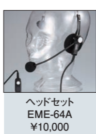
ヘッドセット EME-64A ¥10,000