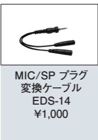
MIC/SP プラグ 変換ケーブル EDS-14 ¥1,000