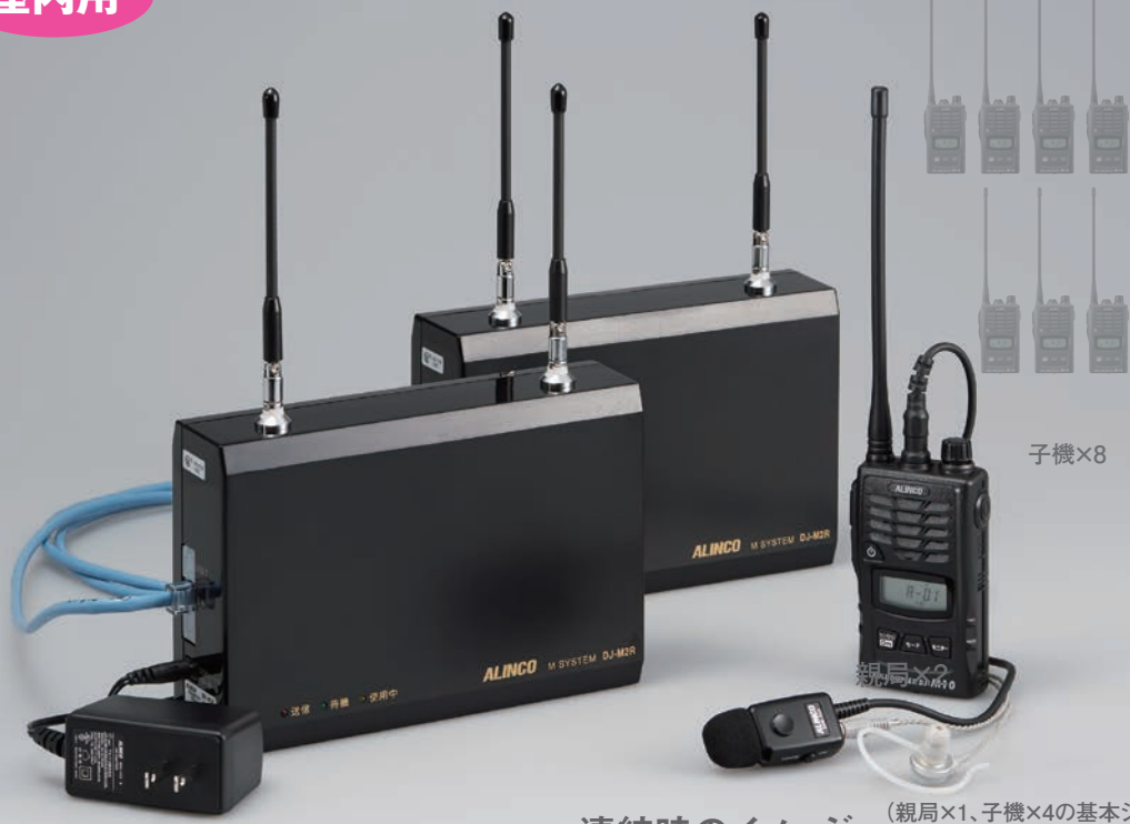
連結時のイメージ (親局×1、子機×4の基本システムもお使いいただけます。)