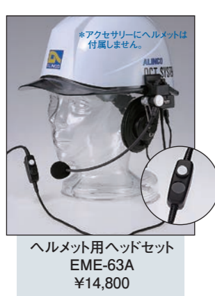
ヘルメット用ヘッドセット EME-63A ¥14,800