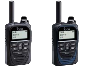
LTEトランスシーバー IP500H PoCトランスシーバー IP501H