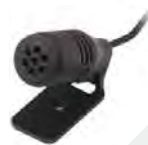
サンバイザーマイク※ GMMN4065

※印のアクセサリを使用する際には、データ通信ケーブル(CT-147)が必要です。