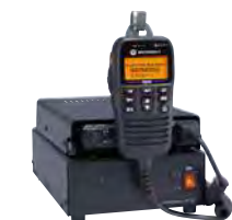
直流安定化電源 FP-33 ※本体・マイク含まず