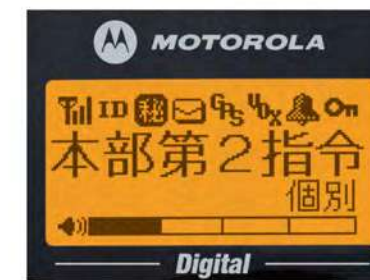
〈ディスプレイ:実物大〉

世界各国で政府機関向けの無線機を供給し、高い評価を得ているモトローラだからこそできる製品(本体)2年保証です。