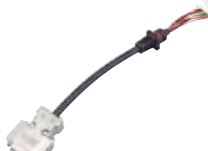
データ通信ケーブル CT-147