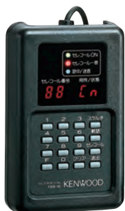
セレコールターミナル TSS-10