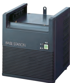
ベースステーション(基地局用) KBS-1