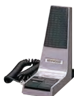
スタンドマイク スタンドマイクは受注生産での対応となります。 弊社無線システム営業部にご相談ください。 Tel:045-443-3122