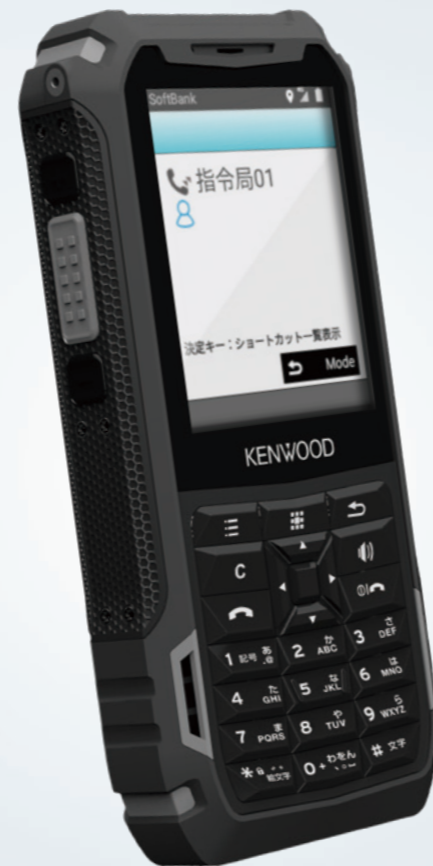
801KW by KENWOOD

ウェブブラウザや静止画・動画を共有できるチャットをはじめとする、ビジネスに役立つインターネットサービスにも対応予定です。