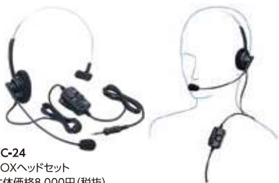
VC-24 VOXヘッドセット 本体価格8,000円 (税抜)