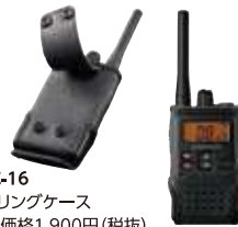
SHC-16 キャリングケース 本体価格1,900円 (税抜)

充電して繰り返し使用できる大容量 Ni-MH電池パック 容量最小値2400mAh/公称値2500mAh