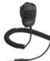
MH-57A4B スピーカーマイク 本体価格4,700円 (税抜)