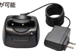
VAC-60 急速充電器セット (付属品と同等) 本体価格2,500円 (税抜)