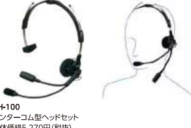
YH-100 インターコム型ヘッドセット 本体価格5,270円 (税抜)

ヘルメットに装着するタイプのヘッドセット ※本体との接続にはCT-87が必要です。