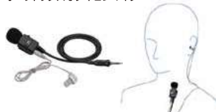
MH-62A4B タイプピンマイク (高感度タイプ) 本体価格6,500円 (税抜)