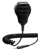
MH-73A4B 防浸型スピーカーマイク 本体価格5,200円 (税抜)