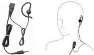
MH-381A4B 小型タイプピンマイク (耳かけイヤホンタイプ) 本体価格3,800円 (税抜)