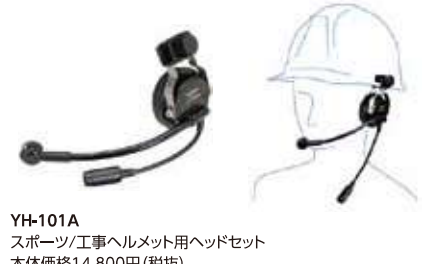
YH-101A スポーツ/工事ヘルメット用ヘッドセット 本体価格14,800円 (税抜)

ヘルメットに装着するタイプのヘッドセット ※本体との接続にはCT-87が必要です。