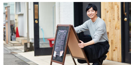
フロアが分かれた店舗などで

スタッフ同士のコミュニケーション向上に最適 飲食業や建設業、地域防災はじめ、多彩な業界やシーンで活用可能