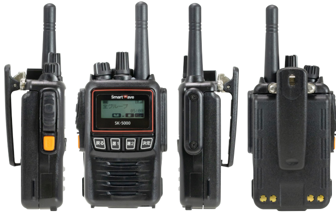
ドコモビジネスランシーバ認定品