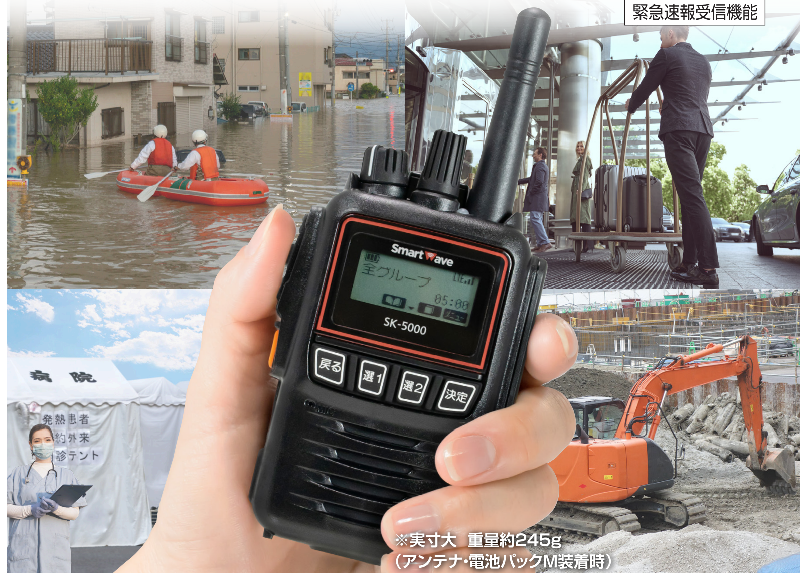
※実寸大 重量約245g (アンテナ・電池パックM装着時)