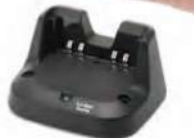
急速充電器 (3h) 標準装備