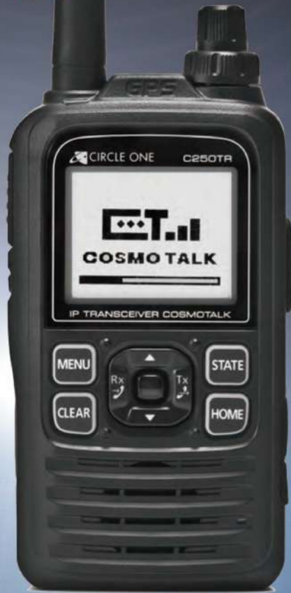
ハンディ・コスモトーク C250TR