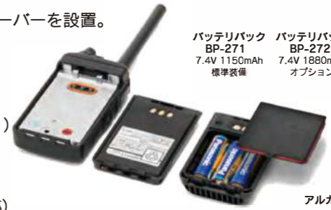
バッテリーパック BP-271 7.4V 1150mAh 標準装備 BP-272 7.4V 1880mAh オプション