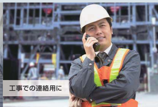
工事での連絡用に