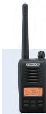
デジタル簡易無線 携帯型登録局対応無線機 D503シリーズ