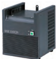
ベース用 スピーカー付き電源 KBS-1