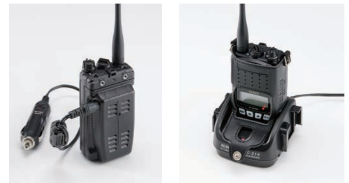
12V/24V対応、車載や基地局運用が可能なEDH-43とEDC-194A ハードケースEHC-70を外さなくても充電できます。