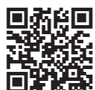
アカウント登録ページ