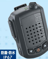
EMS-87B Bluetoothスピーカーマイク