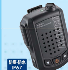
EMS-87BNC ノイズキャンセル内蔵 Bluetoothスピーカーマイク