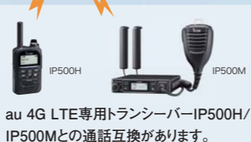
au 4G LTE専用トランシーバーIP500H/ IP500Mとの通話互換があります。