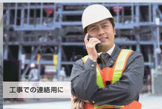
工事での連絡用に